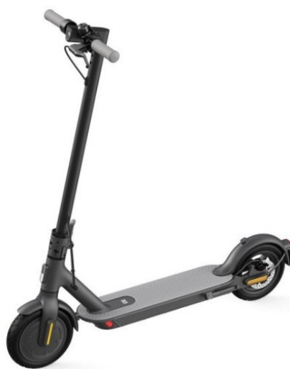
Trotineta electrica Xiaomi