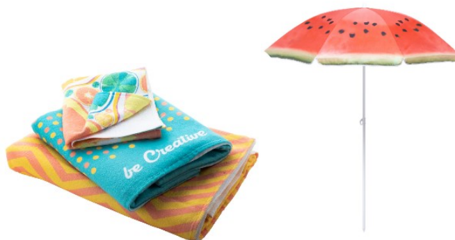
Kit de plaja

*Imaginile premiilor sunt cu titlu informativ