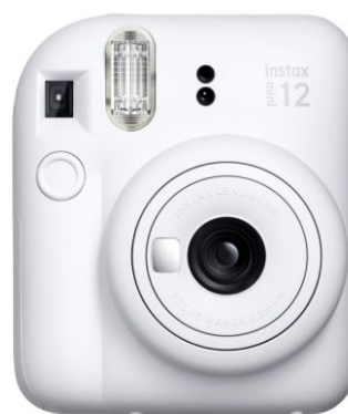
Aparat foto instant Fujifilm Instax Mini 12

*Imaginile premiilor sunt cu titlu informativ