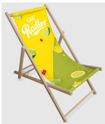
Scaun de plaja